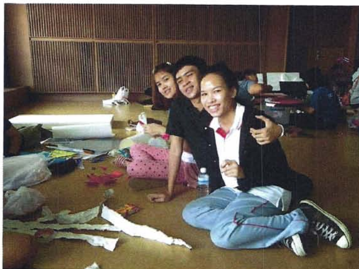
นิสิตร่วมกันจัดบอร์ดนิทรรศการ ในวันที่ 30 พฤศจิกายน 2556 ณ โรงเรียน อัสสัมชัญ กรุงเทพฯ